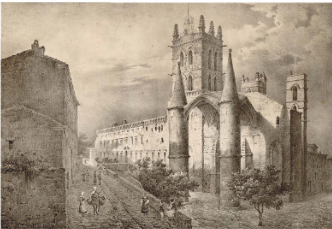
Montpellier, Faculté de Médecine.

Colloque organisé par Sorbonne Université et l'Université Paul-Valéry sous le haut patronage de l'Académie des Inscriptions et Belles-Lettres, avec le soutien de la Société des amis de la Romania et de l'équipe Étude et édition de textes médiévaux (Sorbonne Université), du RESO (Université Paul-Valéry) et du Centre d'Études médiévales de Montpellier (Université Paul-Valéry)