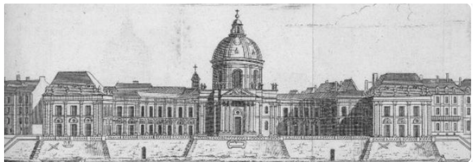
Paris, le palais des Quatre-Nations, siège actuel de l'Académie des Inscriptions et Belles-Lettres.

Ce sont les aspects scientifiques, historiques et politiques qui seront étudiés à partir de l'analyse comparée des deux revues.