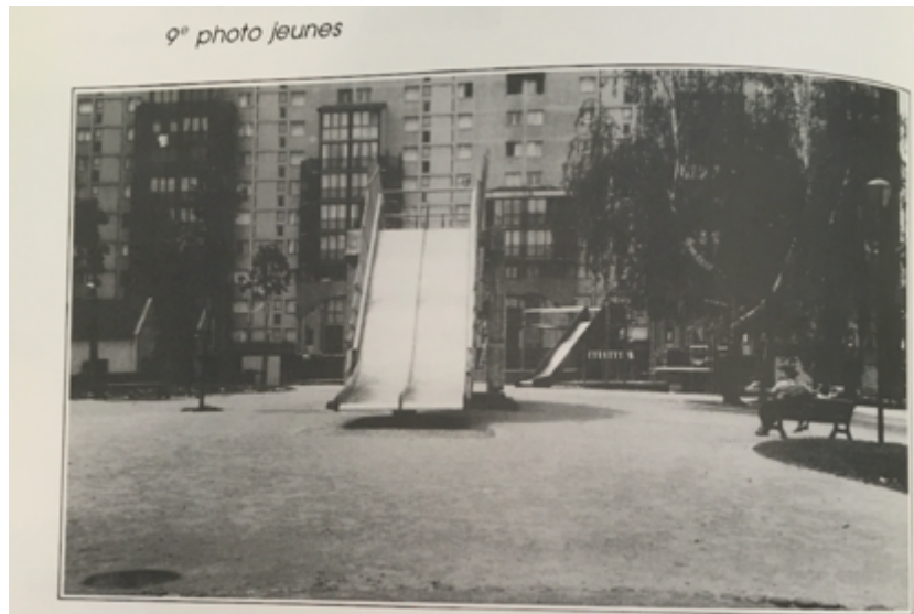
Fig. 4. « 9 e photo jeunes », terrain de jeu devant la barre la « Locomotive », quartier les Résidences, Belfort. Photographie prise par un jeune du quartier, Ma Maison , 1989.