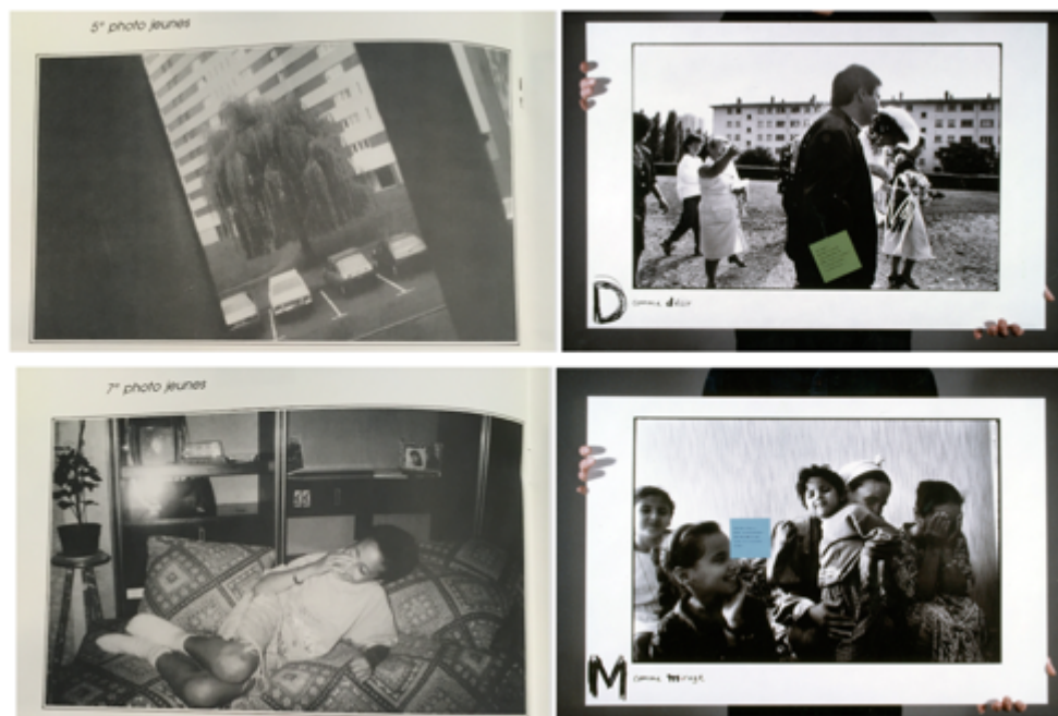
Fig. 5. À gauche : « 5 e photo jeunes » et « 7 e photo jeunes » extraites du catalogue institutionnel. À droite : deux panneaux de l'exposition portative Ma Maison correspondant aux lettres « D comme désir » et « M comme mirage », photographies André Lejarre, 1989.