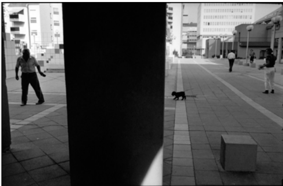
Fig. 3. André Lejarre, Ma Maison , quartiers HLM de Belfort, 1989.