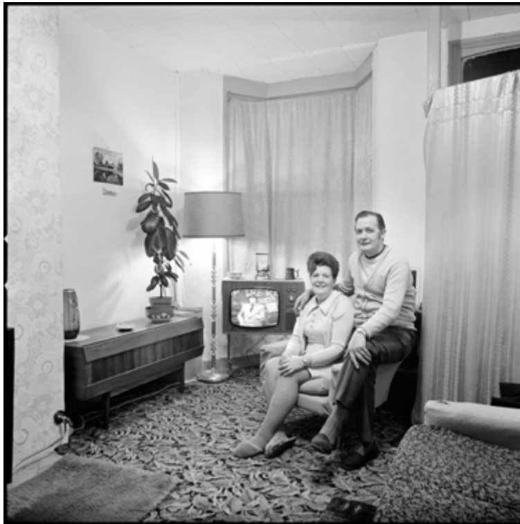
Fig. 9. Daniel Meadows, Martin Parr, June Street, Salford , 1973.

atteste de la visée utilitaire des images du fait de la dimension mémorielle du projet photographique. Selon le protocole mis en place, les photographes respectent les normes esthétiques identifiées au « style documentaire » (Lugon, 2001) lorsqu'ils adoptent un cadrage frontal, une distance juste entre le photographe et son sujet dans un souci de neutralité afin de répondre à une esthétique de l'analyse. La production en noir et blanc obéit à un idéal de lisibilité de la scène photographiée pour une description visuelle de ces intérieurs (Fig. 9). À l'inverse, André Lejarre désobéit au souci d'objectivité et de neutralité pour exprimer sa présence dans une sorte de corps à corps photographique (Fig. 10 et 11).