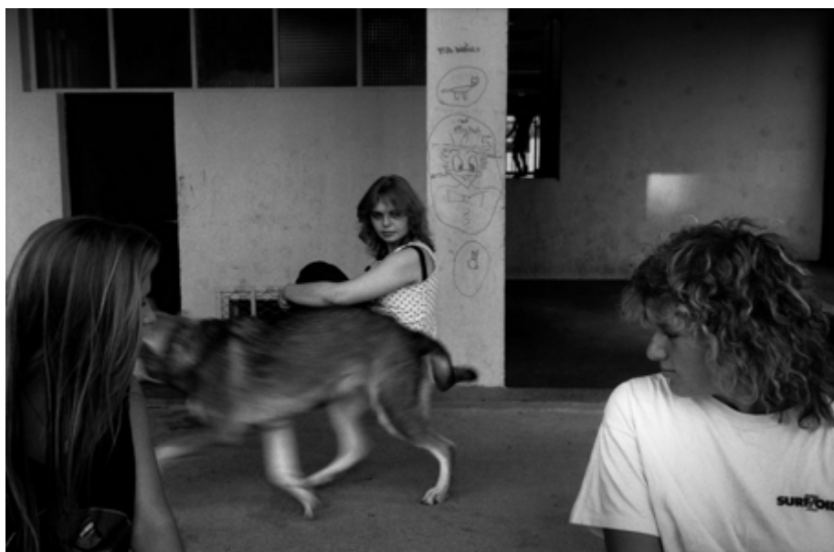
Fig. 7. André Lejarre, Ma Maison , quartiers HLM de Belfort, 1989.

L'écrivain avait contesté le titre de travail initialement choisi par le photographe, « 'La vie HLM' car trop banal et trop froid. [Jean-Louis Sagot-Duvauroux] propose 'Ma Maison', plus chaleureux et plus en accord avec le projet de description et de valorisation de l'habitat social » (Lejarre, 2022, n. p.). Quant à André Lejarre il avoue que, même si d'ordinaire il est pessimiste, il prend « généralement des photos plutôt souriantes 15 ». Pourtant, ses images ne s'accordent pas avec un regard convenu et consensuel, « elles ne montrent pas que le bon côté des choses » ( Le Pays , 2022, p. 1). Il y a des temps suspendus, peut-être de l'ennui, dans certaines scènes du quotidien qui se déroulent dans un décor urbain peu chaleureux, où se lisent les traces d'usure, et parfois même de délabrement (Fig. 7).