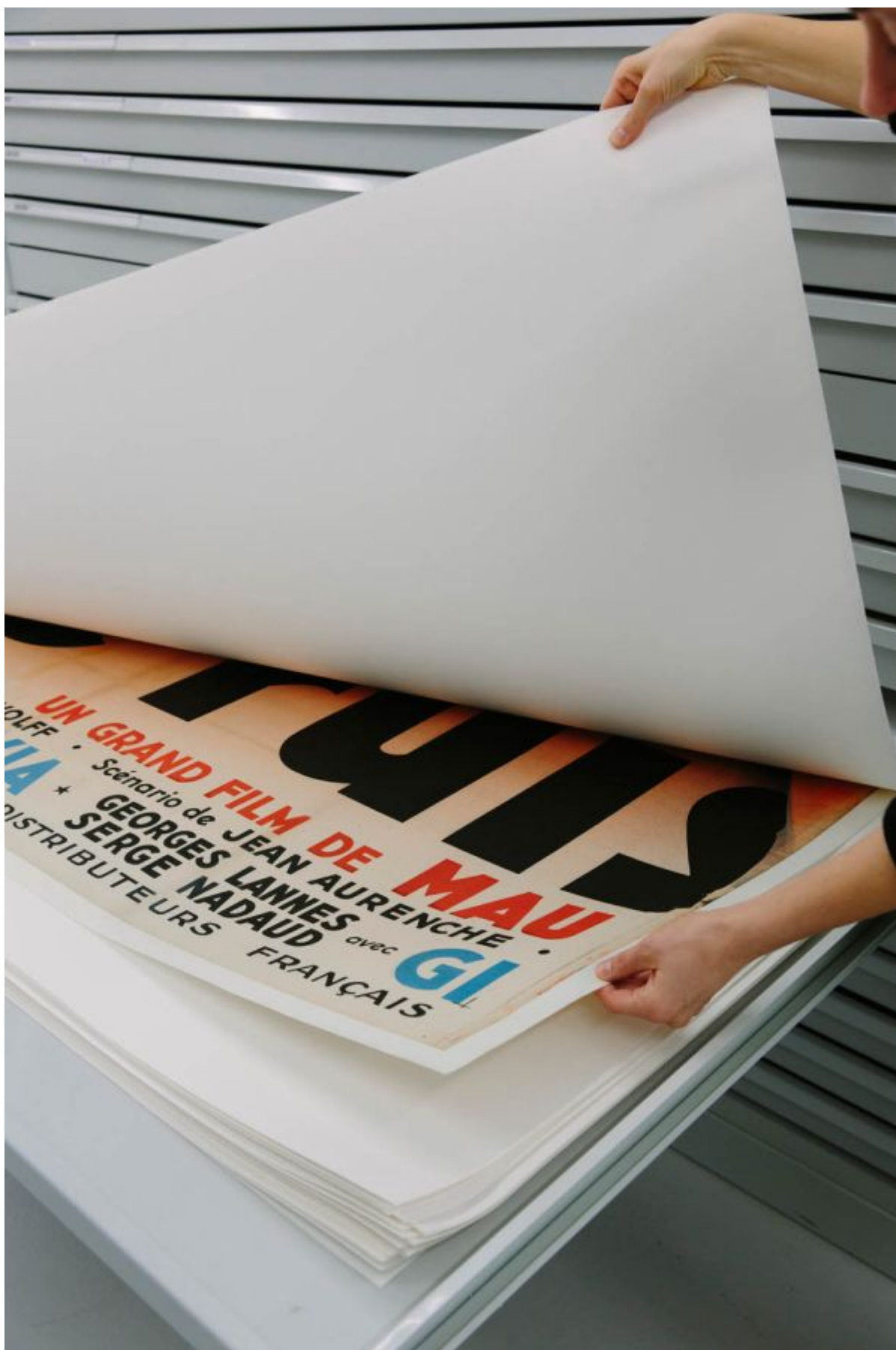
Fig. 1 : La collection d'affiches conservées par la Cinémathèque suisse à Penthaz.