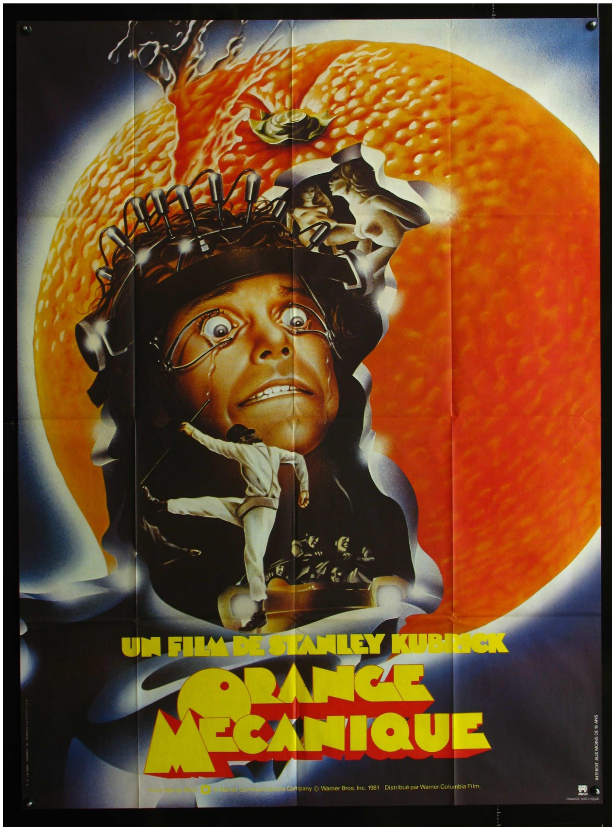
Fig. 2 : Affiche française d'A Clockwork Orange .